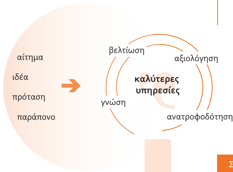
Σχήμα κύκλου εργασίας Crowd360

Υποβολή προτάσεων για βελτίωση των παρεχόμενων υπηρεσιών της εταιρίας και υποβολή παραπόνων.